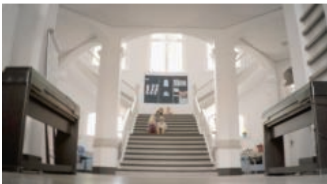
Obs De Koekoek in Utrecht zit in een gebouw uit 1903, een gemeentelijk monument. In 2017 heeft een inpandige verbouwing plaatsgevonden.