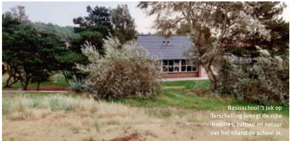
Basisschool 't Jok op Terschelling brengt de rijke tradities, cultuur en natuur van het eiland de school in.