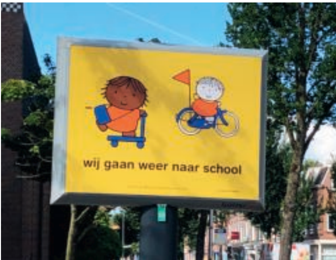
Vlakbij Kindercampus Molenpark staat dit billboard: een perfecte illustratie als de wijk ook daadwerkelijk vol zou staan met (meer) gemengde scholen. Maar dat is niet zo (zie kader).