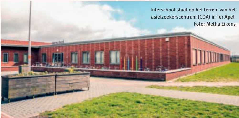
Interschool staat op het terrein van het asielzoekerscentrum (COA) in Ter Apel.