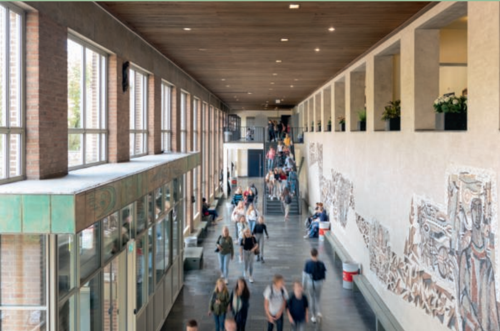
Het Sint-Janslyceum in Den Bosch is gehuisvest in een schoolgebouw dat in 1961 werd ontworpen in de Bossche Schoolstijl.

‘WIJ HEBBEN HIER LAATST NIEUWE DIGIBORDEN GEKREGEN DIE KLEINER ZIJN DAN DE OUDE, WAARDOOR ER NIEUWE GATEN GEBOORD MOESTEN WORDEN. MAAR MISSCHIEN MOET JE DIT NIET IN JE ARTIKEL ZETTEN’