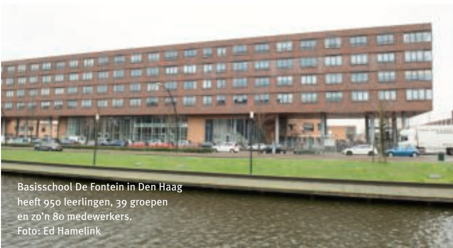
Basisschool De Fontein in Den Haag heeft 950 leerlingen, 39 groepen en zo'n 80 medewerkers.

De Fontein heeft 39 groepen, 950 leerlingen en zo'n 80 medewerkers. "Toen ik twintig jaar geleden solliciteerde op de functie van schoolleider zei ik: 'Als de school eenmaal staat, ben ik weg.' Een grote school leek me heel onpersoonlijk. Maar het is bij ons nooit saai. Er gebeurt altijd iets."