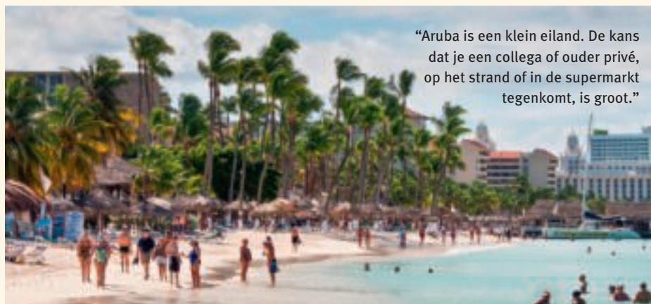
“Aruba is een klein eiland. De kans dat je een collega of ouder privé, op het strand of in de supermarkt tegenkomt, is groot.”

de supermarkt tegenkomt, is groot.” Als schoolleider moet je stevig in je schoenen staan, vindt La Haye, “Veel moet je zelf regelen. Bijscholing gaat digitaal of we vliegen deskundigen over. Ook het lagere voorzieningenniveau op Aruba vraagt veel creativiteit.”