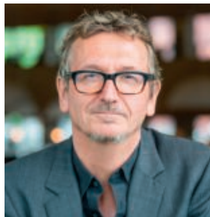
Maurice Crul, hoogleraar diversiteit en onderwijs aan de Vrije Universiteit Amsterdam: “Leraren met een migratieachtergrond gebruiken vaak hun eigen achtergrond als instrument om het debat aan te gaan.”

Ander gesprek in lerarenkamer Het onderwerp diversiteit staat al veertig jaar op de agenda, maar de discussie verandert, constateert Crul. “Voorheen praatte voornamelijk witte schoolteams over leerlingen en ouders met een migratieachtergrond. Nu witte Nederlanders in de grote steden geen numerieke meerderheid meer zijn en de groep waar vroeger over gesproken werd nu als collega’s aan tafel zit, krijg je een ander gesprek in de lerarenkamer. Leraren die zelf een migratieachtergrond hebben, kunnen er bijvoorbeeld